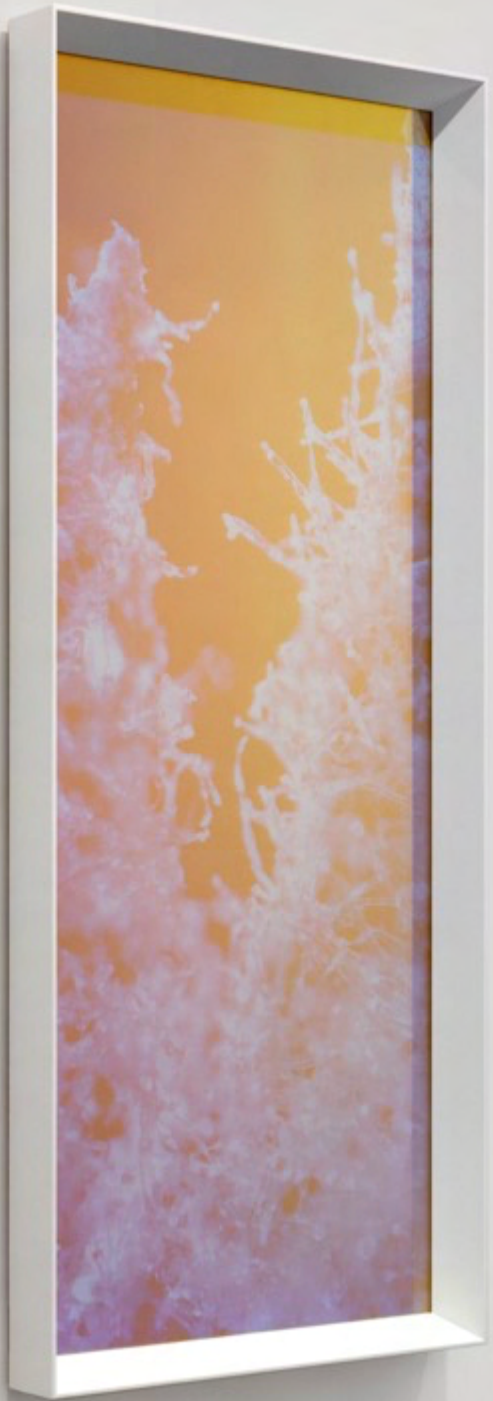
Dana-Fiona Armour Vue Microscopique Numéro 2 (Nicotiana Benthamiana transgénique), 2022 (alternate view)