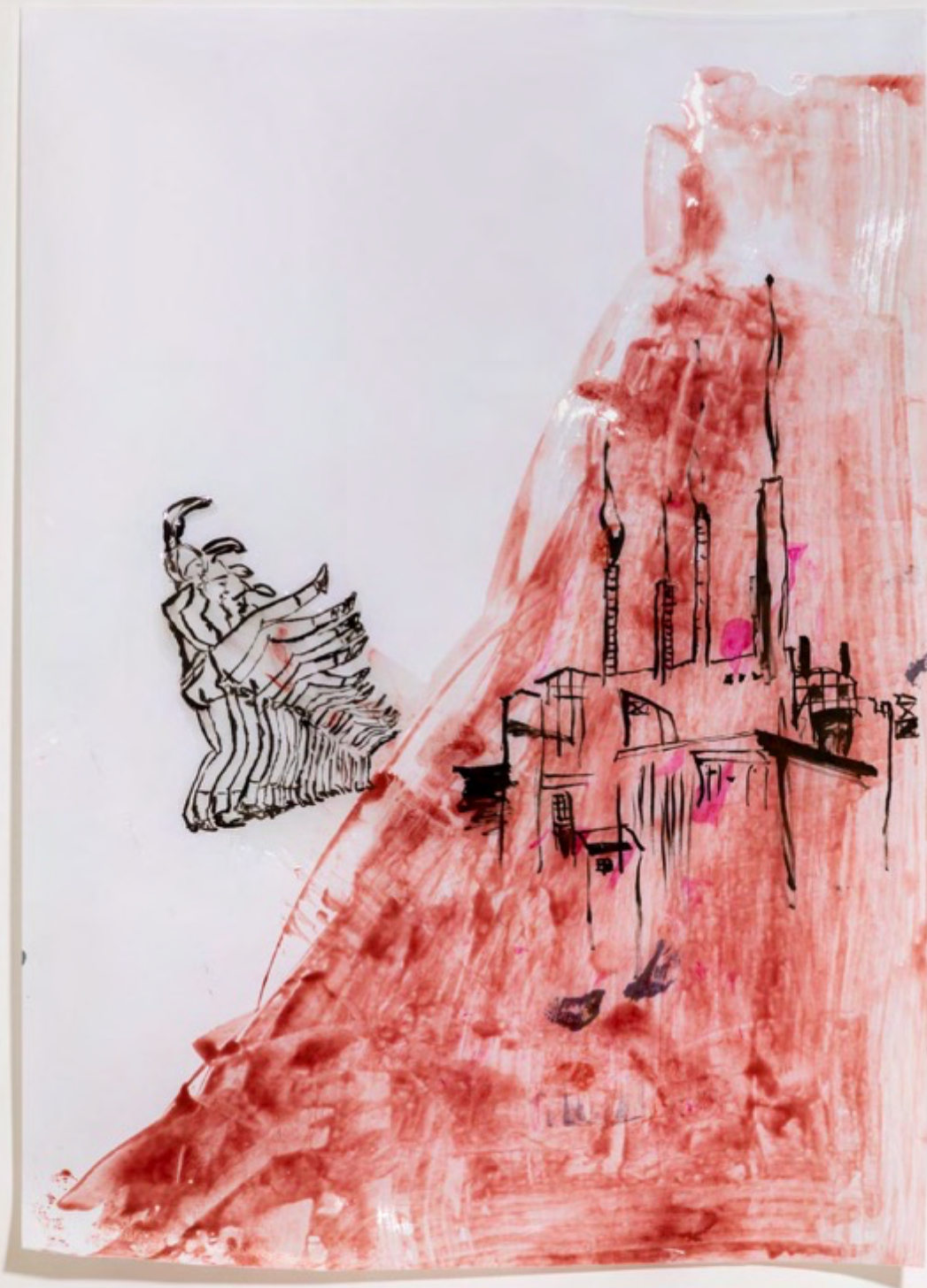
Cecilia Bengolea Bodies As Protest, 2022 Multichrome ink, biological resin, acetate paper 63 x 46 cm (24 3/4 x 18 1/8 in.)