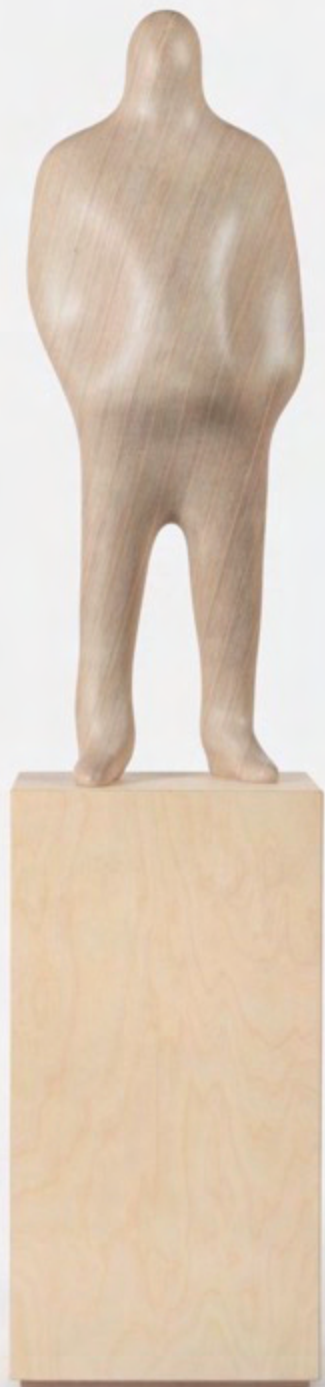
Xavier Veilhan Tom Moulton , 2022 Birch plywood 80 x 40 x 27 cm (31 1/2 x 15 3/4 x 10 5/8 in.)