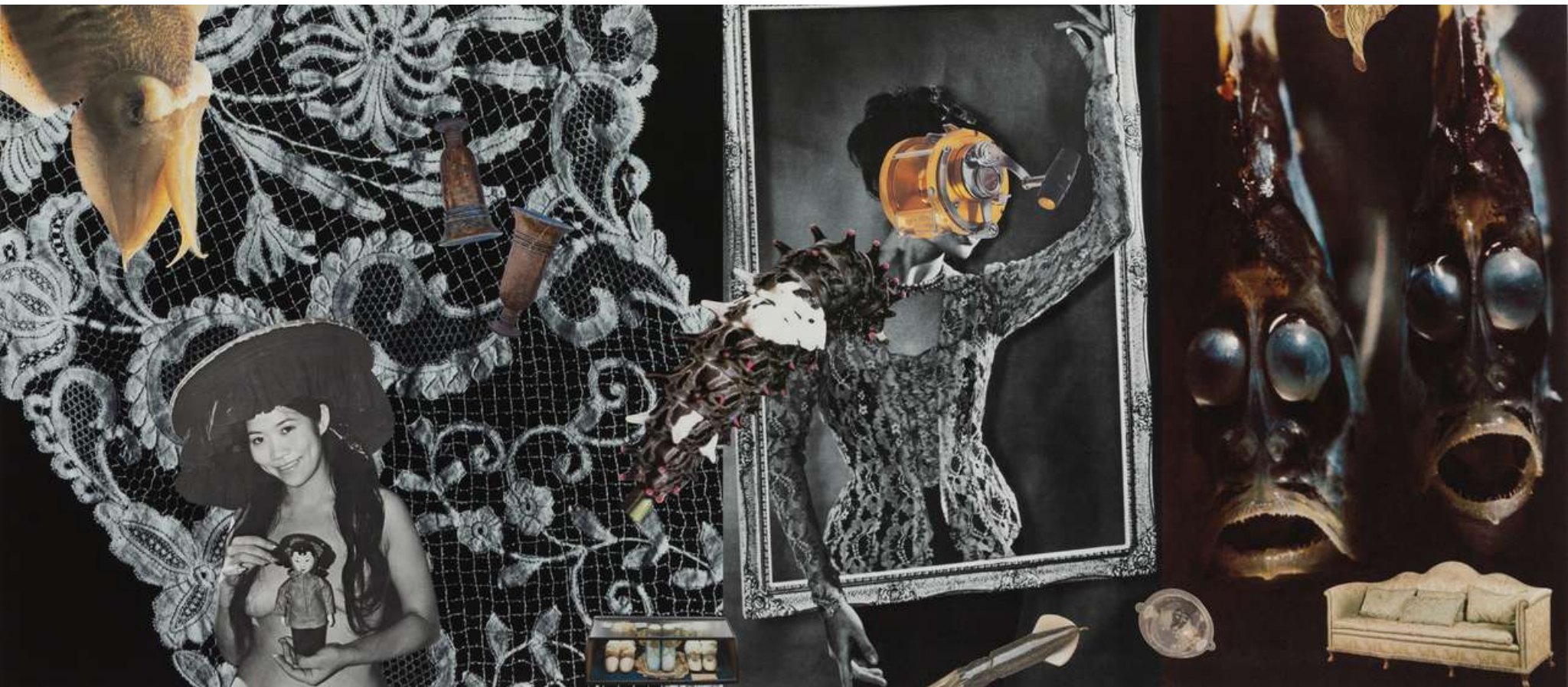
Linder Ye Xian , 2023 Photomontage 70 x 132 cm Incl. frame