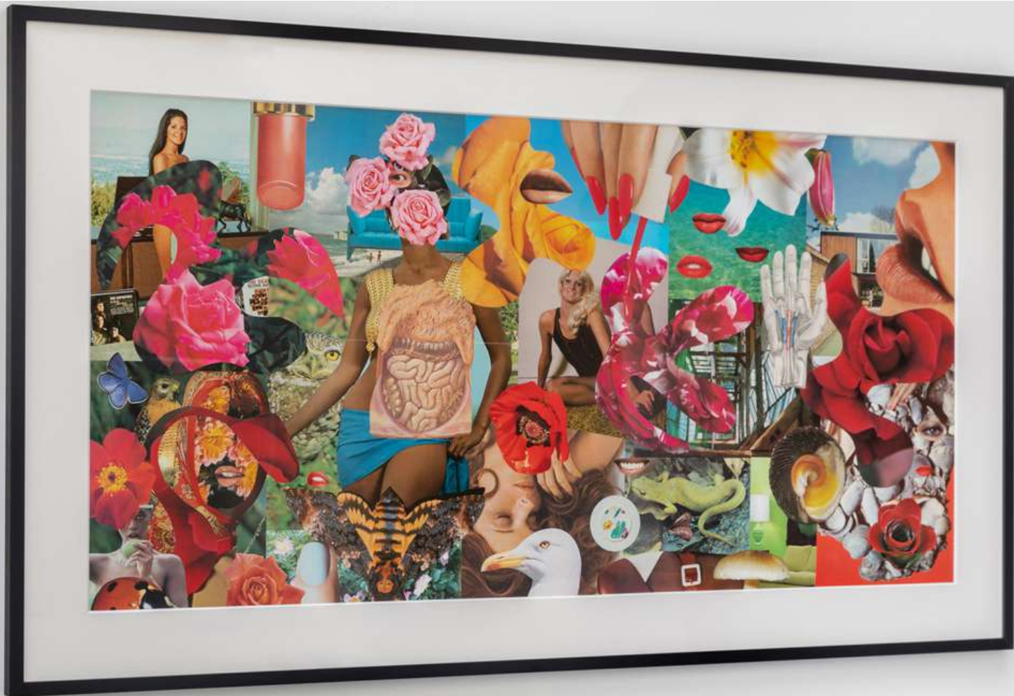
Linder The Pool of Life , 2021 Photomontage 77 x 137 cm Incl. frame