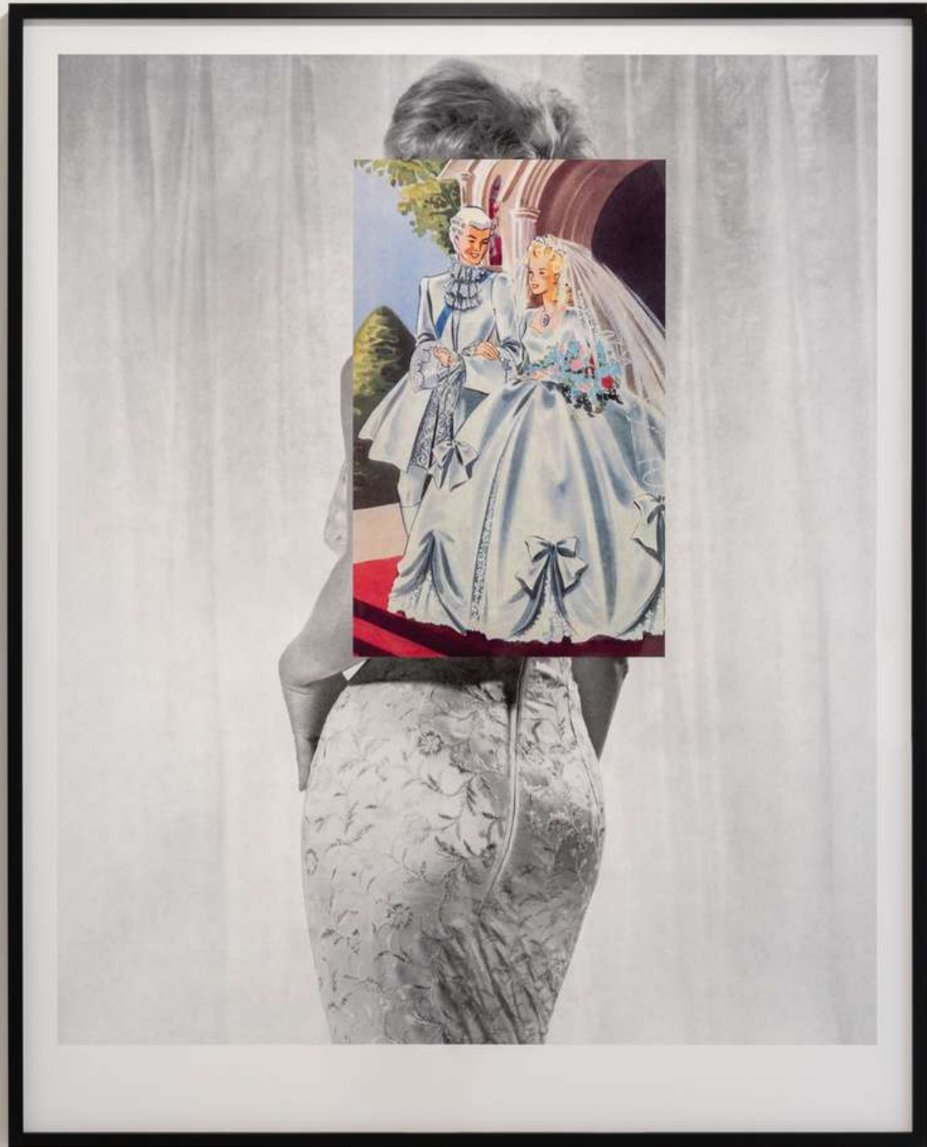
Linder Once upon a time, 2023 Giclée print Ed 3 + 2AP 150 x 120 cm Incl. frame