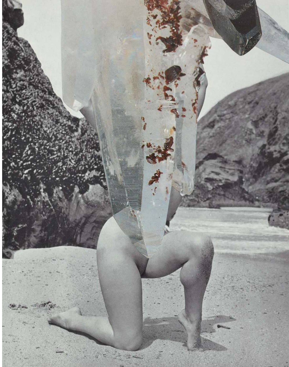
Linder Merry Maiden (III) , 2021 Photomontage 41,6 x 35,3 cm Incl. frame