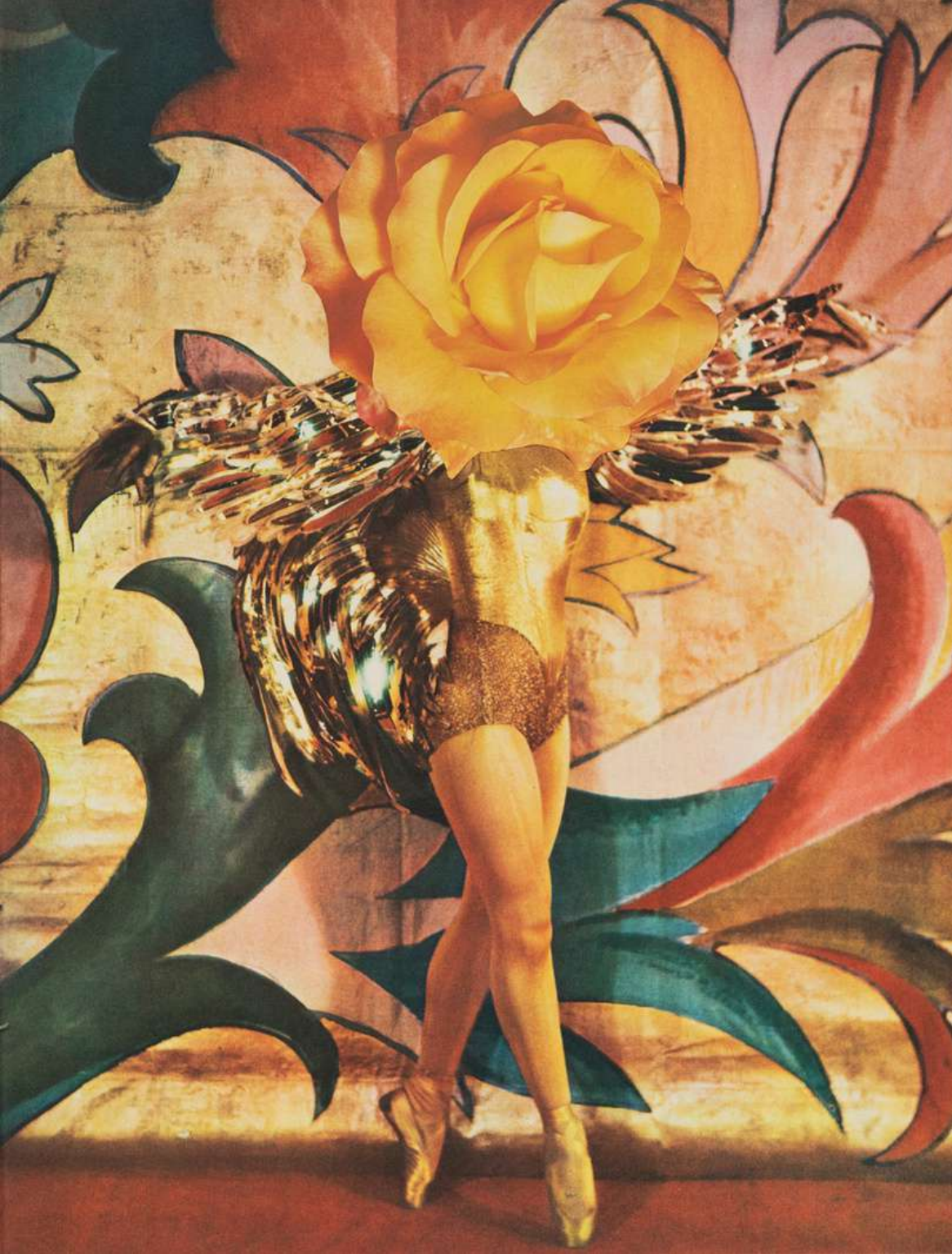
Linder Arrows of desire , 2023 Photomontage 40 x 33 cm Incl. frame