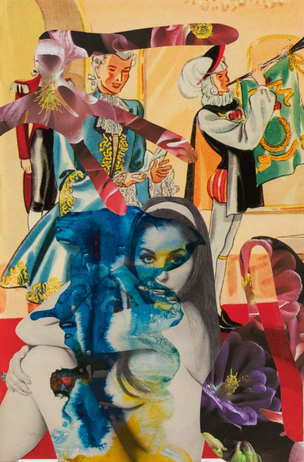
Linder Boost the charm stat, 2023 Photomontage 54 x 40 cm Incl. frame