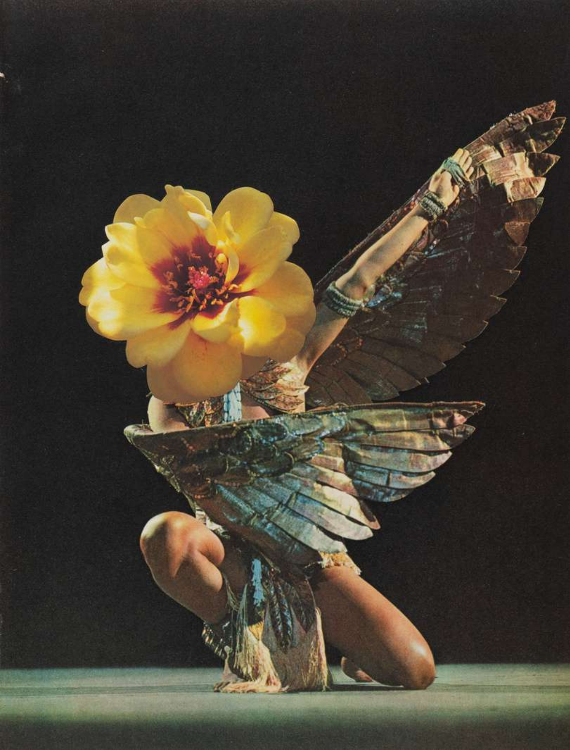
Linder Bow of burning gold, 2023 Photomontage 40 x 33 cm Incl. frame