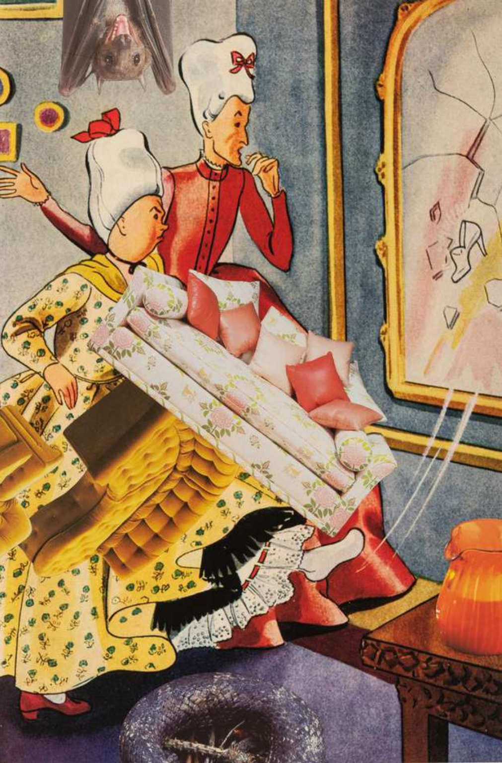
Linder Nocturnal Flash , 2023 Photomontage 54 x 40 cm Incl. frame