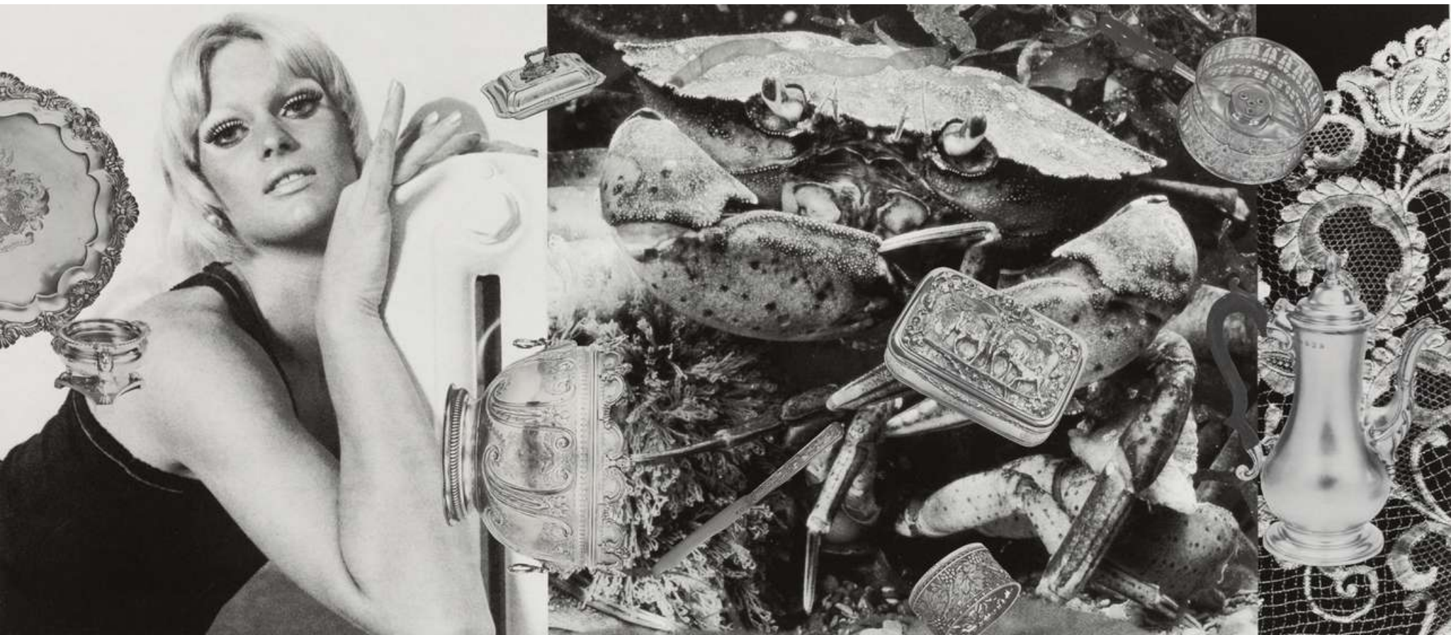
Linder Petal Boundary , 2023 Photomontage 70 x 132 cm Incl. frame