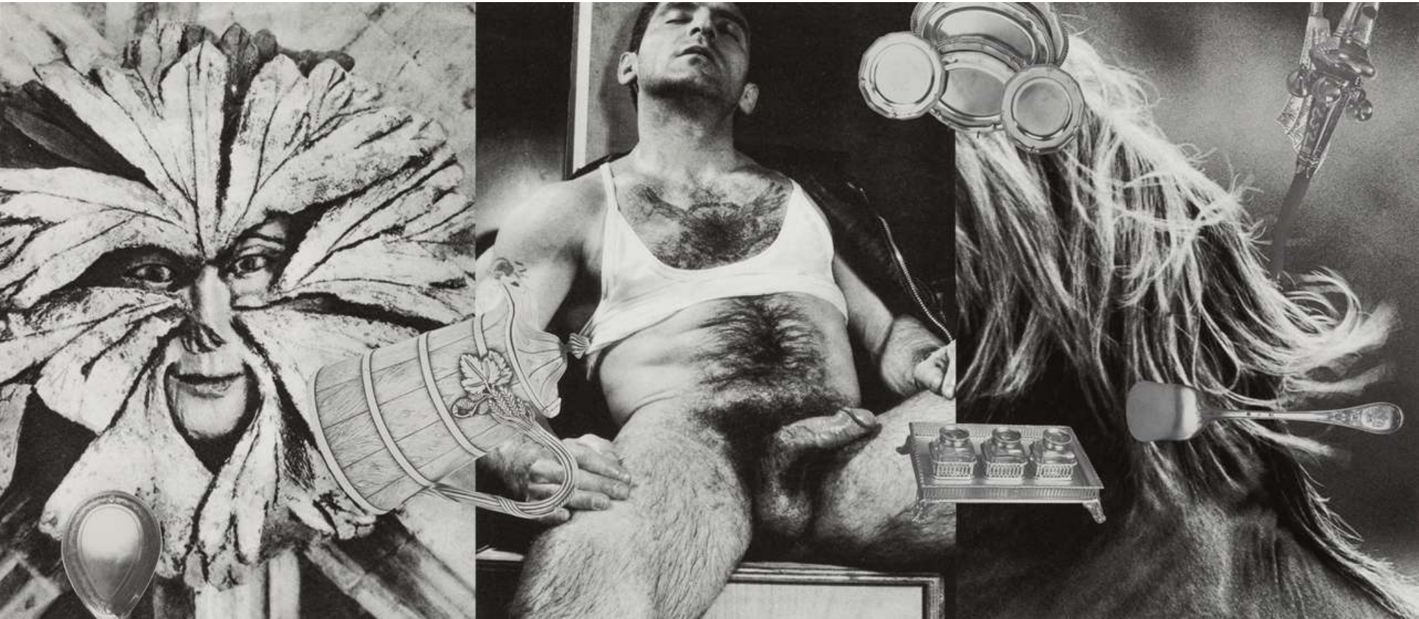
Linder Sing the body electric , 2023 Photomontage 70 x 132 cm Incl. frame