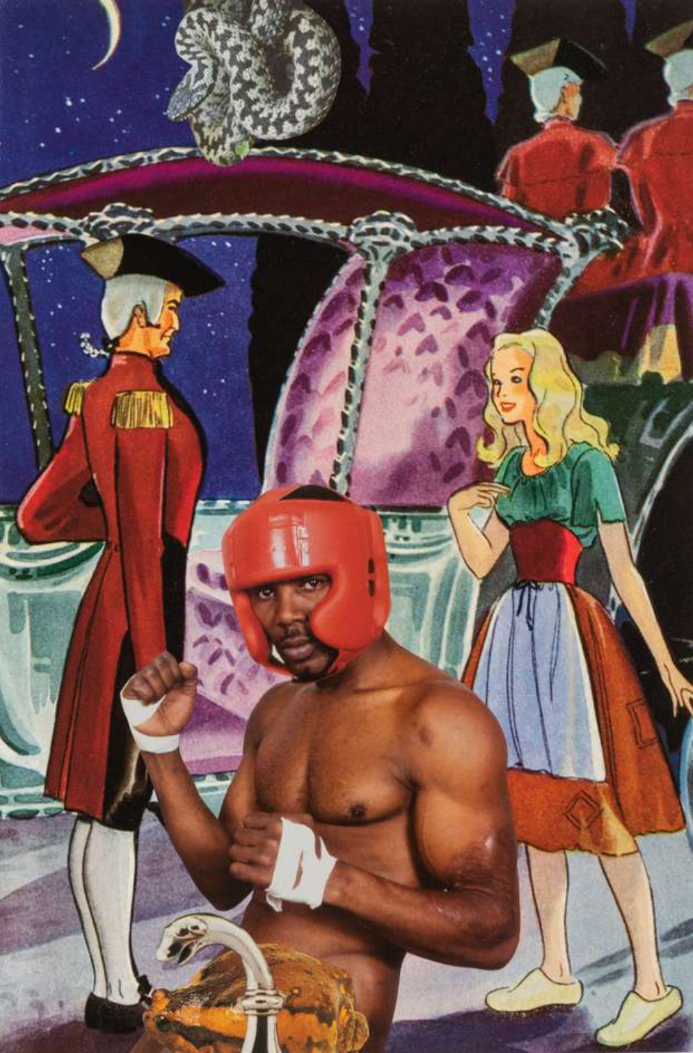
Linder Veil of Midnight , 2023 Photomontage 54 x 40 cm Incl. frame