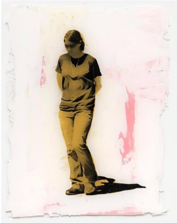
"Oh mother, what have you done #032" Foto: Annika Elisabeth von Hausswolff

I vår individualistiska och bildrika tid får anonymiteten en slående effekt. Det är den som får mig att ställa frågan: under vilka omständigheter kunde det här ha varit jag?