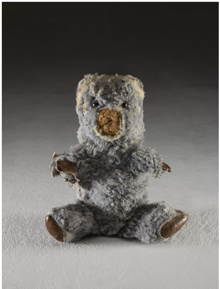
"The body of anthropocene".