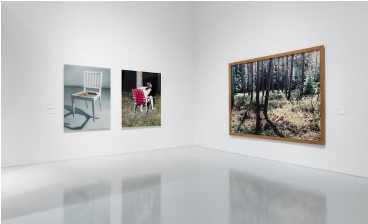
Installationsbild med verken "Filosofisk stol", "Varje rörelse bär på sin motsats" och "Tillbaka till naturen".