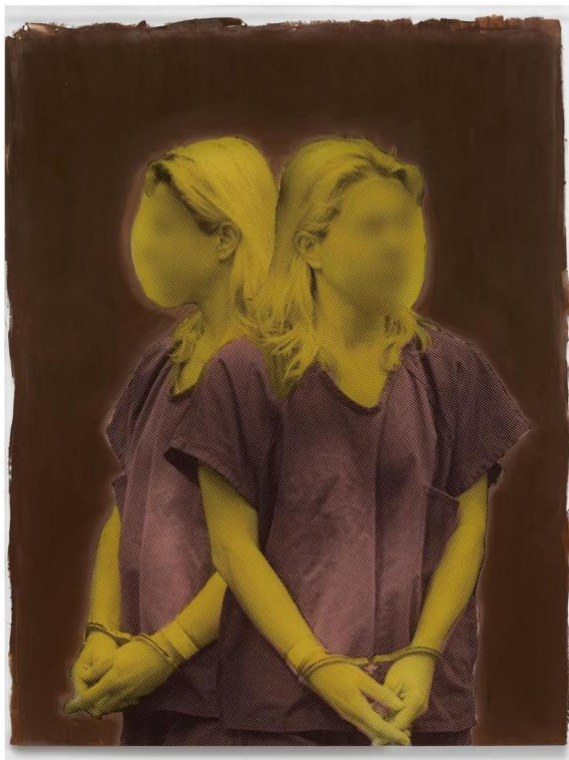
"Oh mother, what have you done #008" Foto: Annika Elisabeth von Hausswolff

Efteråt är jag faktiskt lite omtumlad. Annika Elisabeth von Hausswolffs fotografier är av det sällsynta slag som utvidgar perceptionen och öppnar för nya sätt att avläsa vardagen och dess många bilder. Och just det är något av det finaste konst kan göra.