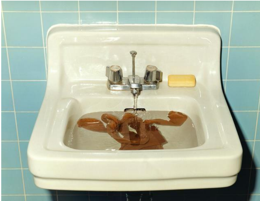
"Allting hänger ihop ha, ha, ha".

tankegångar och sätt att förhålla sig till massmedia utvecklades sedan i olika riktningar av von Hausswolff och hennes generationskamrater.