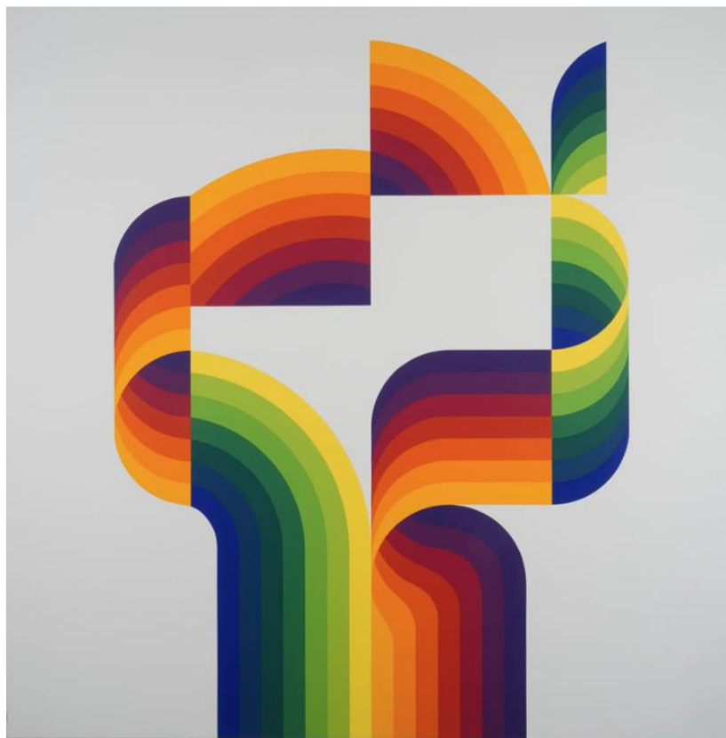
Julio Le Parc, "Permutation de la Longue Marche no.1", 2020. Akryl på duk.

Konstgalleriernas höstupptakt bjuder på en gammal mästare, sträva ytor, motorsågsskulpturer, mycket färg och en hel del humor. Först ut är klustret av gallerier kring Hudiksvallsgatan i Stockholm.