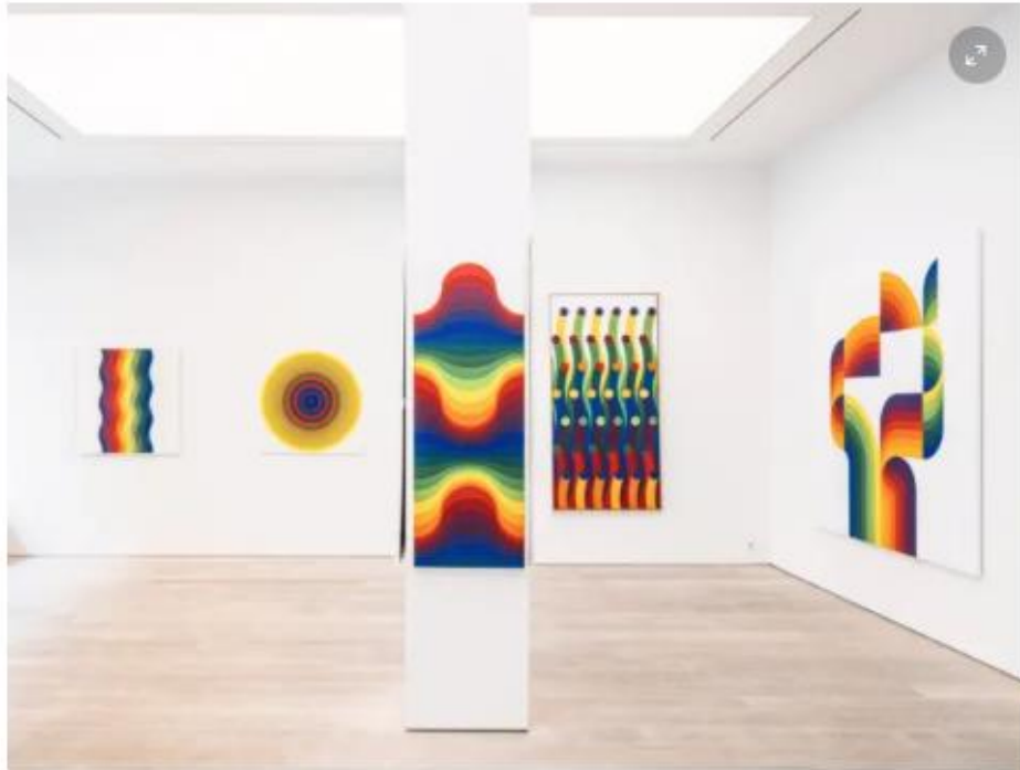
Julio Le Parc, installationsvy på Andréhn-Schiptjenko.