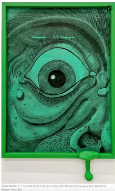
Jonas Nobel, ur "The steel which cuts your body and that wich bruise your soul" på Andys Gallery.