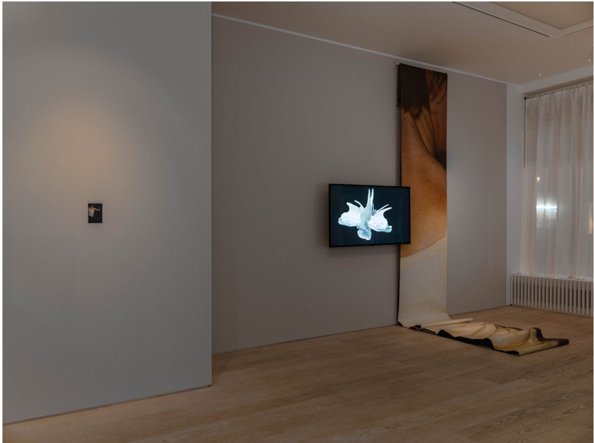
Santiago Mostyn, Flex, fotografi och vepa, 2019 & The Promise, HD-video, installationsvy, 2013.