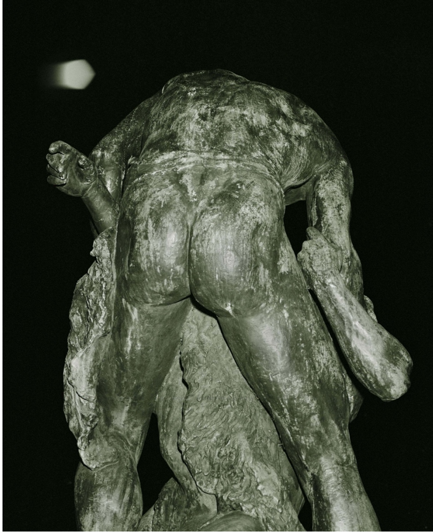
Santiago Mostyn, Ghost / Monument , detalj, 2020.

Teman som konsumtion, makt och framställning återkommer i Flex (2019), ett uppförstorat fotografi av en svart man och vit kvinna i omfamning som är omöjligt att uppleva i sin helhet då endast en smal snibb av det enorma trycket exponeras. Ett liknande grepp återkommer i Ghost / Monument (2020), som sitter på baksidan av den vägg som filmen projiceras mot. Verket består av vad som ser ut att vara sidor ur tidningar som Ebony eller Jet , komplett med reklam för hårprodukter, och en ram som sticker ut från väggen. På ena sidan sitter en bild av en människa där ansiktet tycks upplöst. På andra sidan ser man en närbild av en staty, där baksidan av en naken människa framträder köttig och våldsam, böjd över något som tycks vara halvt människa, halvt objekt, som sträcker sina händer mot skyn, som ett rop på hjälp, som ett fritagningsförsök.