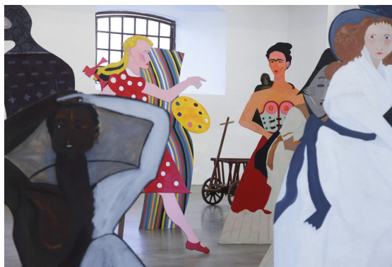
Lubaina Himid, Vernet's Studio , 1994.