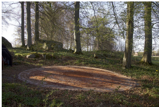
Latifa Echakhch, Blush , 2018/2019.