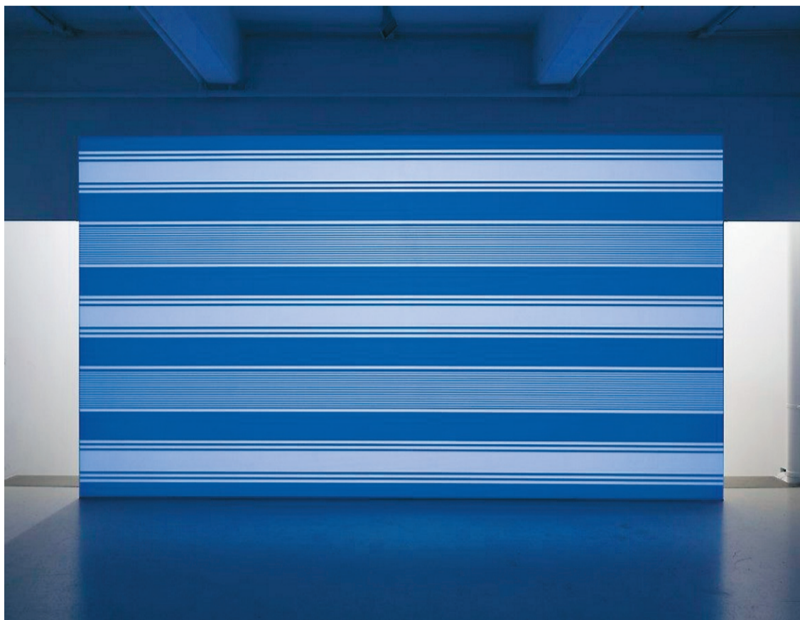
"Neoconcrete space". Video, 2012.