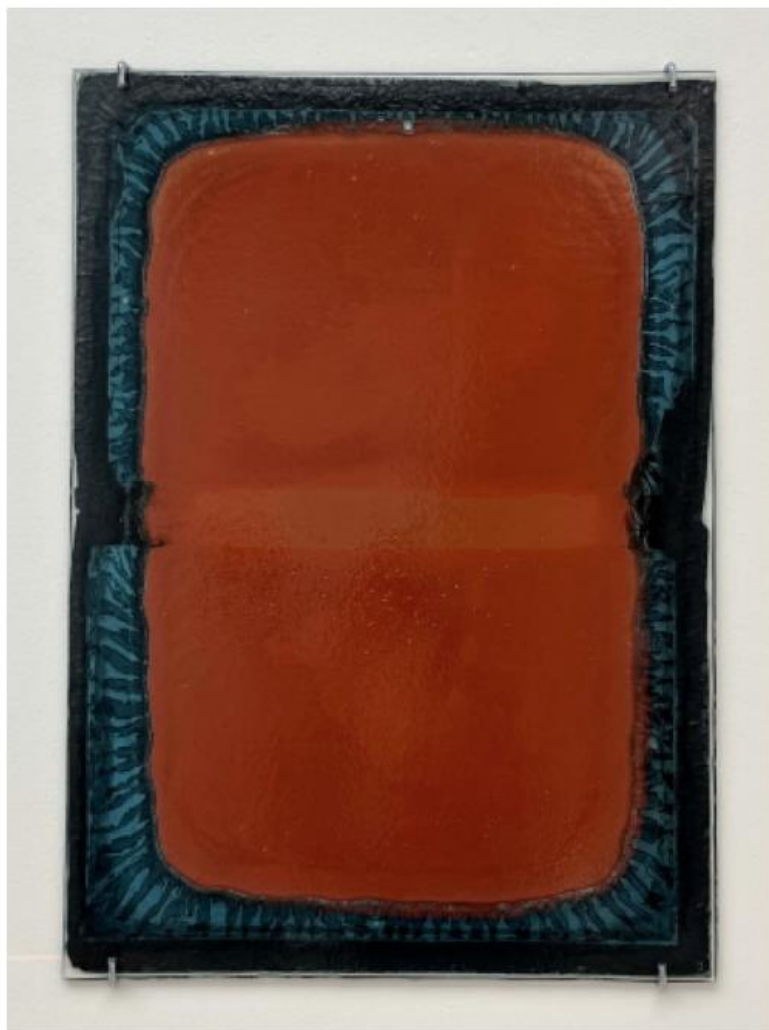
THERESA TRAORE DAHLBERG COPPER AND BLUE I, 2022.