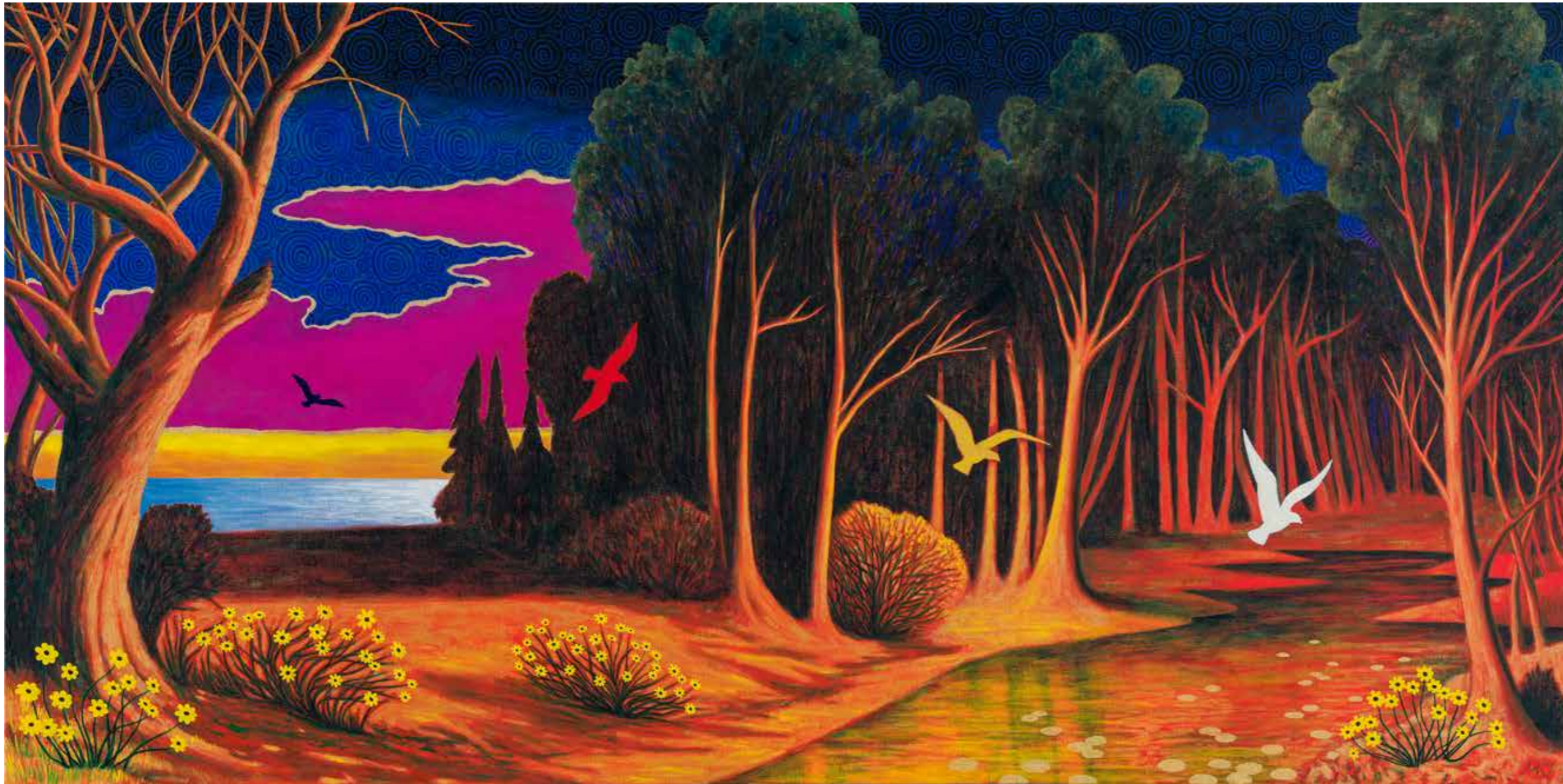
Martin Jacobson, Spektrum , olja på duk, 2020.