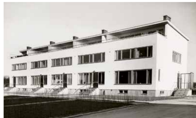
Radhus i Örgryte, Göteborg, ritat av arkitekt Ingrid Wallberg.