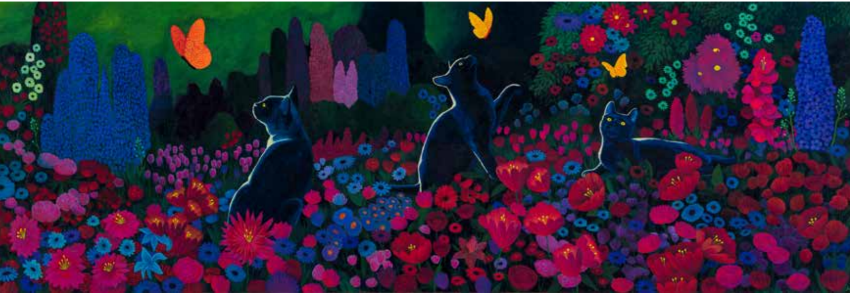
Allegoriska katter, olja på duk, 2020.