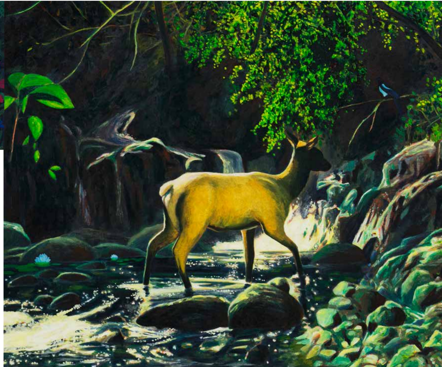
Nr 57, olja på duk, 2017.

– Örebro konstskola var fantastisk. Jag hade tecknat och målat hela livet, och gymnasiet var bara en lång väntan på att få börja på en konstskola. Så det