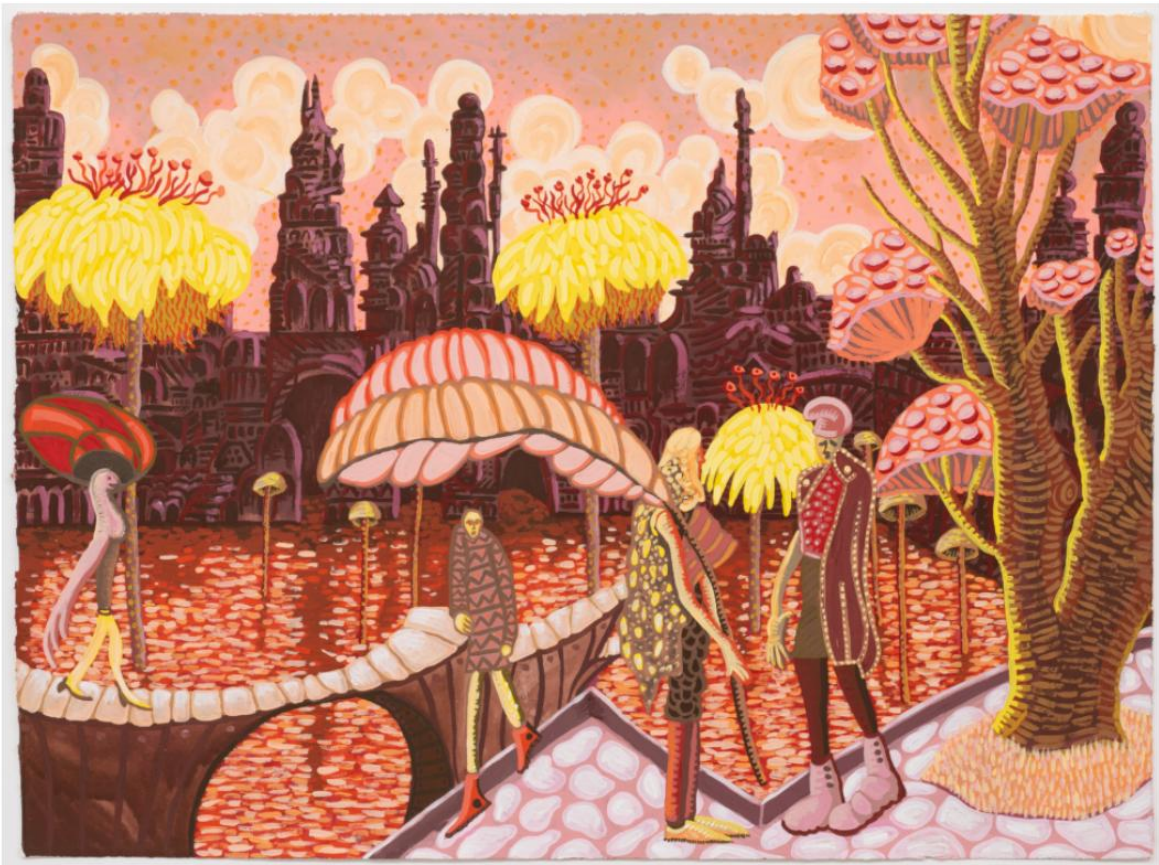
Mark Frygell, Riverside, gouache på papper, 56 x 77 cm, 2023.

För Galleri Thomassen i Göteborg har Mark Frygell skapat en serie gouachemålningar med titlar som refererar till vardagliga platser som förorten, stadshuset och biblioteket. Ändå för verken tankarna till en utomjordisk planet där färgerna, ljuset och rummet betar sig enligt för mig okända lagar. Hans gåtfulla bildvärld befolkas av väsen som i vissa fall liknar människor men ibland ser ut som arketyper av alltifrån makthavare till dansare och trädgårdsmästare.