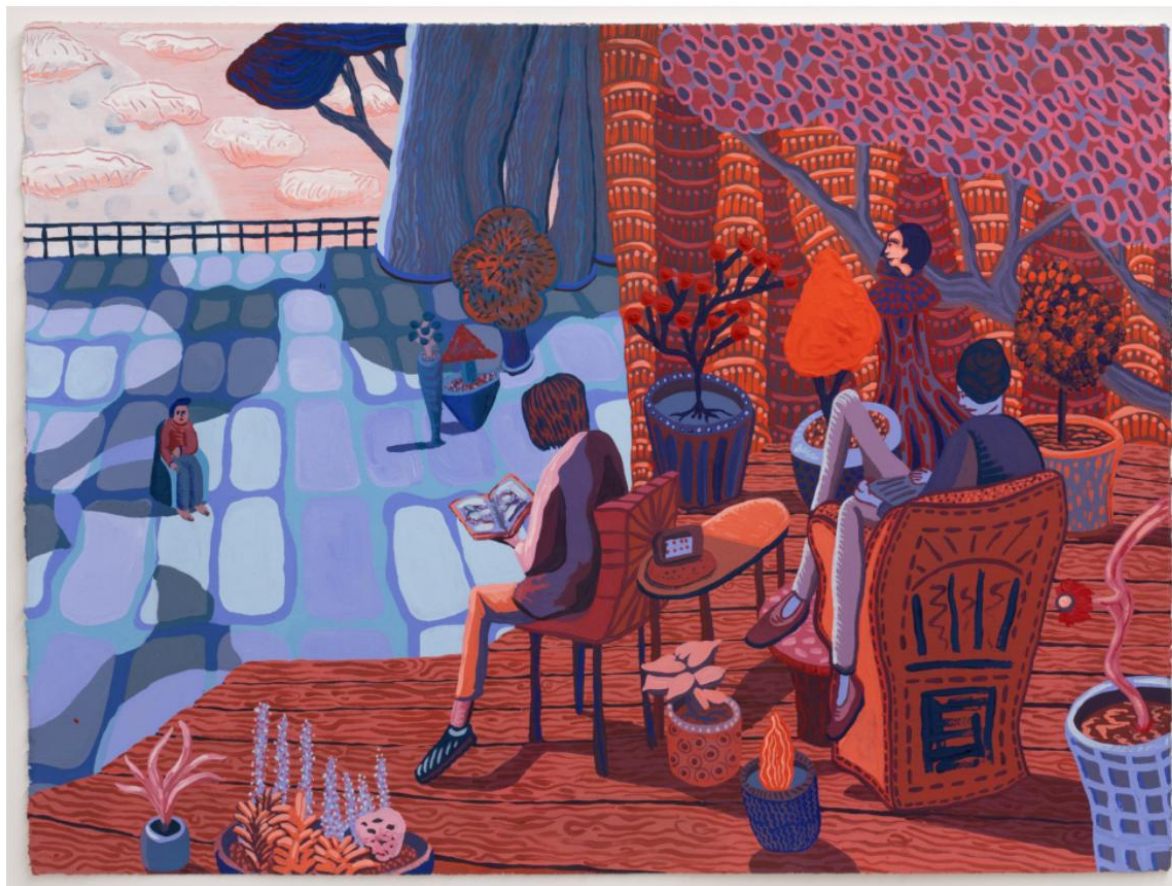
Mark Frygell, Library , gouache på papper, 56 x 77 cm, 2023.

Målningen Place of Worship (2022) visar ett triangelformat tempel med halmtak och två munkar som bär runt på vad som skulle kunna vara ett snidat altarskåp eller en sorts krubba från en hednisk kult. Där finns även en skulptur som tycks föreställa ett andligt men för mig okänt väsen, samt en hängningsanordning med en hög avhuggna huvuden.