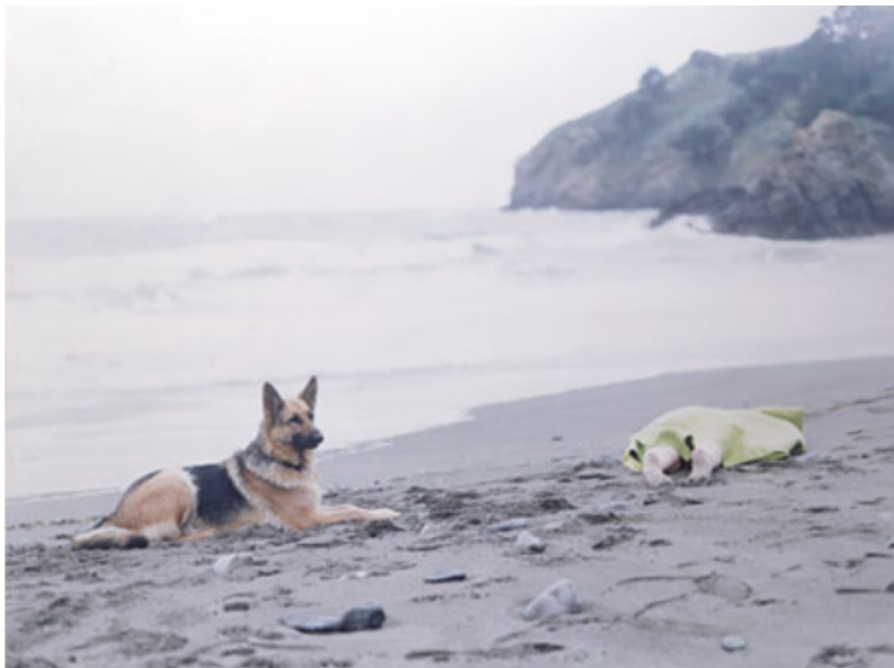
Hey Buster! What Do You Know About Desire? , 1995 © Annika Elisabeth von Hausswolff