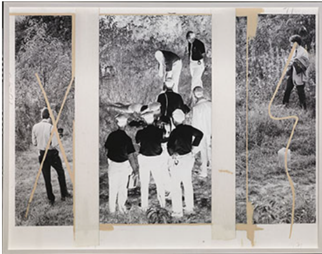
The Photographer , 2015 © Annika Elisabeth von Hausswolff

Referenser till konsthistorisk ikonografi återkommer i bilden Alone with Bubble , där von Hausswolff blåser upp en tuggummibubbla som täcker stora delar av ansiktet.