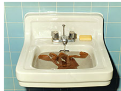
Allting hänger ihop ha, ha, ha. , 1999 © Annika Elisabeth von Hausswolff