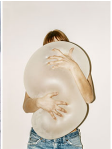
Försök att hålla ordning på tid och rum, 1997/2001