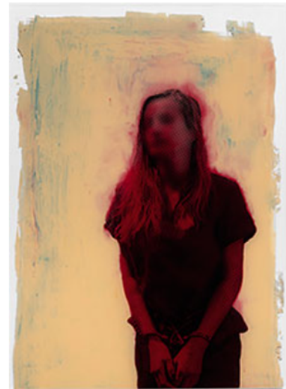
Oh Mother, What Have You Done #035, 2020