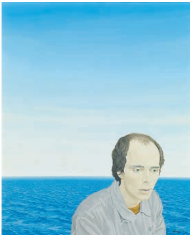
Ulla Wiggen, "Horisonten", 1969. Akryl på masonit.