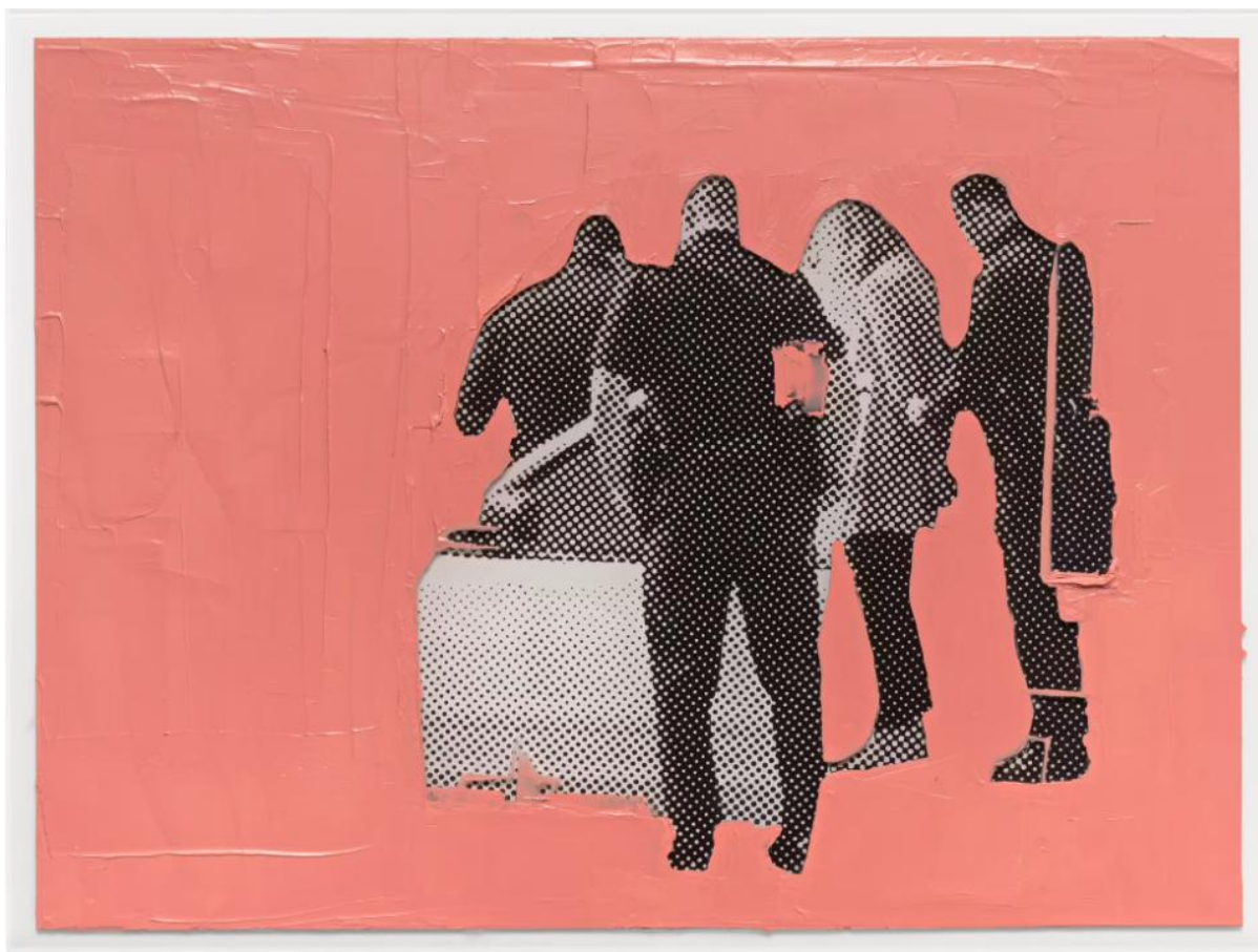
Annika Elisabeth von Hausswolff, "Oh mother, what have you done #002", 2019.

Fascinerande glidning mellan mardröm och begär