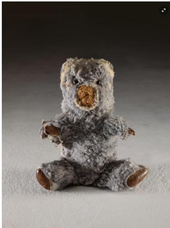
Annika Elisabeth von Hausswolff, "The body of anthropocene", 2020. Foto: Annika Elisabeth von Hausswolff

Presentationen på Moderna rymmer ett hundratal verk från debuten i början av 1990-talet fram till det senaste som skapats speciellt för detta tillfälle. Det är dock inte kronologin som styr presentationen. I stället handlar det om ett konstnärligt universum med en egen visuell logik. "Tiden är en plats" lyder titeln på von Hausswolffs text i utställningskatalogen.