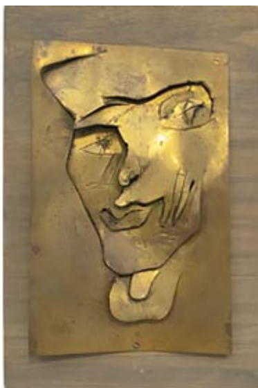
Alva Myrdal