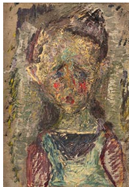
Liten flicka i manssamhälle (Klicka på bilden för hög upplösning)

Därför är det också viktigt att gå till källorna och fundera över varför hon var Sveriges kanske mest betydande modernist, förutom humanist, stor poet med en sträng moralisk kompass. I fallet med Östermalmstorg driver hon sitt material till sin yttersta spets genom att förmedla handens känsliga tecknande genom att blåstra i betong, en värdig manifestation för freden, jämställdheten och rättvisan. Och det är den radikala inställningen till processen och verkets inneboende motiv som är hennes signum och gör henne ständigt aktuell.