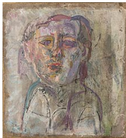
Barnporträtt © Siri Derkert (Klicka på bilden för hög upplösning)

En tämligen ung Ulf Linde skriver inlevelsefullt om den då betydligt mer erfarna Siri Derkert i serien Bonniers små konstböcker från början av 1960-talet. Det är en fin liten bok med kommentarer och skisser av Derkert som hejar på skribenten: "Ulf! Glöm inte bort vad musiken betytt för mig." I texten närmar sig Linde ett förhållningssätt till det sedda som han kom att vidareutveckla, skillnaden mellan olika framställningssätt som bygger på det avgjutna eller det konstruerade.