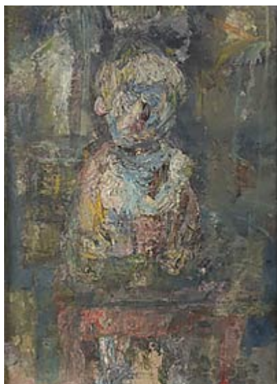
Barnbarn (Stefan) © Siri Derkert Foto: Andréhn-Schiptjenko