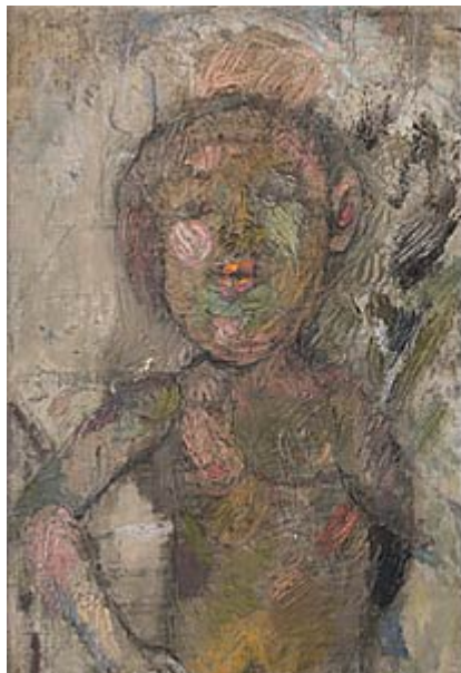
Tora II © Siri Derkert. (Klicka på bilden för hög upplösning)