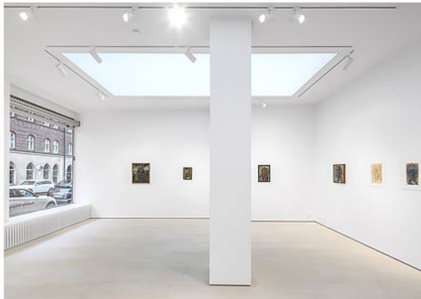
Installationsvy

Det borde permanent pågå en utställning med konstnären Siri Derkert. Men det räcker med att se ett levande verk av henne om dagen. Det gör de flesta som passerar tunnelbanestationerna T-Centralen och Östermalmstorg i Stockholm. Genom hennes verk kalibrerar man sin moraliskt, estetiska klocka som mot ett atomur, men med den skillnaden att Siris klocka är ett ständigt bultande hjärta för det bästa i människonaturen.