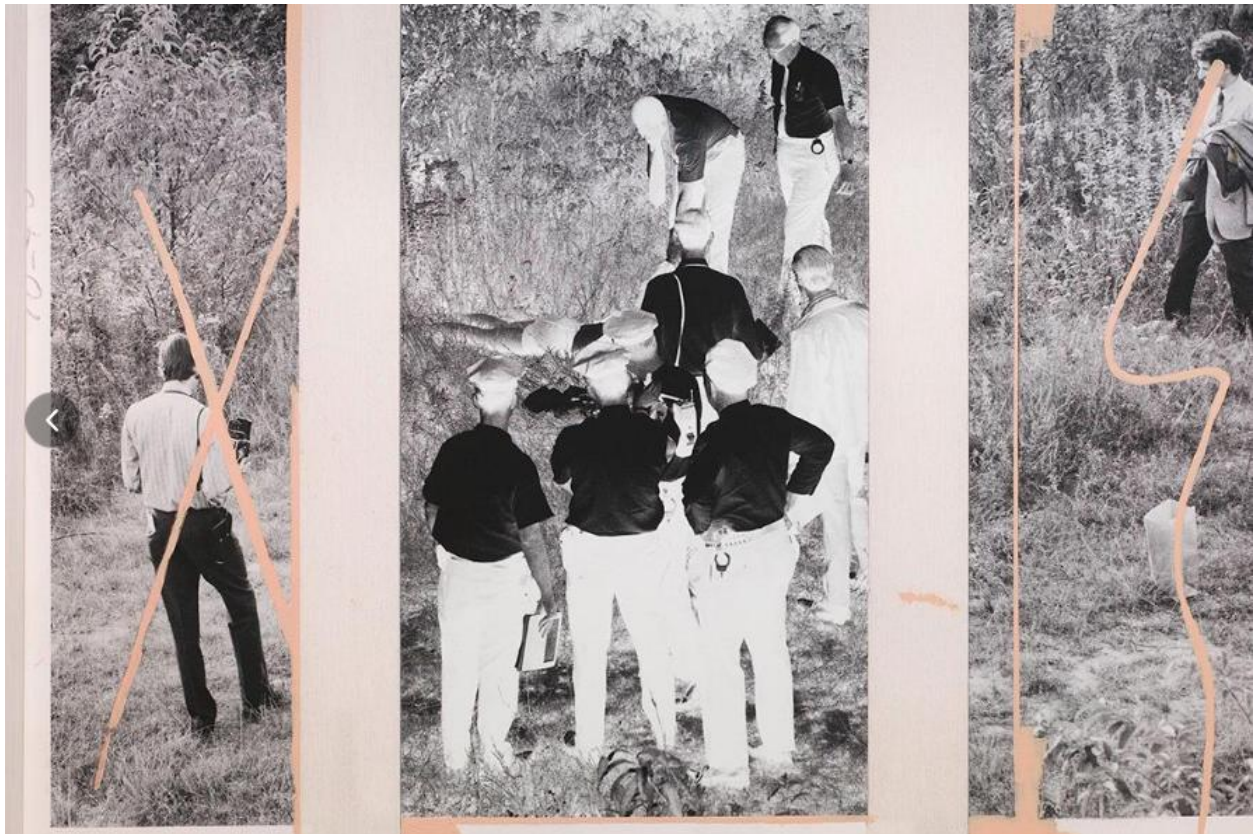
Annika von Hausswolffs "The Photographer" från 2015

Ett obrutet intresse för kriminologi, maktstrukturer och psykologi som löper genom serier av iscensatta fotografier och digitalt bearbetade arkivbilder. En gestaltningsförmåga att skala av det välbekanta kring en vilt främmande kärna, och ett seende som blottlägger, som söker sig bortom hörnet in i avigheten.