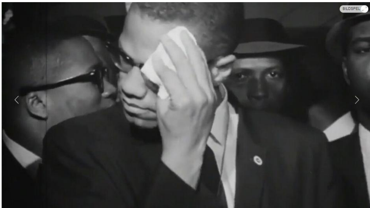
Bild 3 av 4 Malcolm X i Santiago Mostyns filmtriptyk "Altarpiece". Foto: Santiago Mostyn