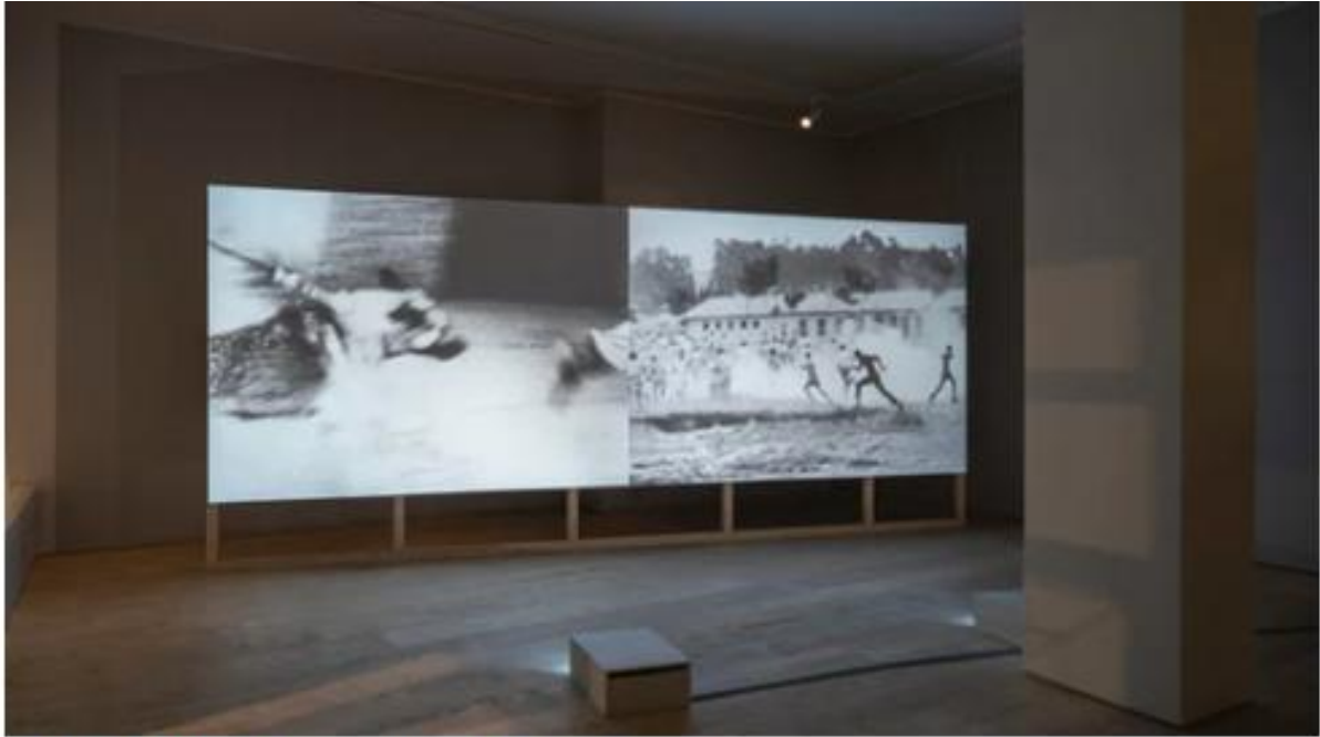
Stillbild från Santiago Mostyns "Altarpiece".

Triptyken består i övrigt av material som Mostyn hittat på nätet och i olika offentliga eller privata arkiv, och knyter an till USA, Trinidad & Tobago och Zimbabwe – det vill säga platser som är viktiga för konstnärens egen historia.