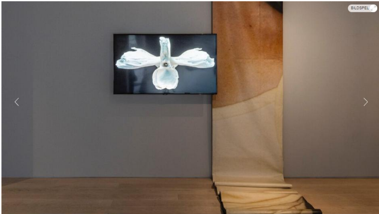
Bild 4 av 4 Santiago Mostyn, "The Promise". Foto: Jean-Baptiste Béranger