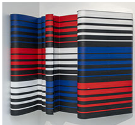
© Jacob Dahlgren (klicka på bilden för hög upplösning)