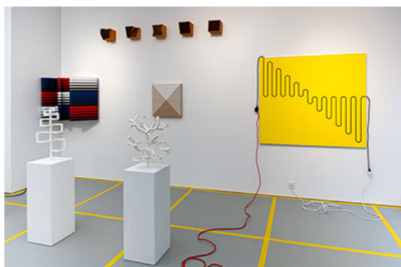
Installationsvy © Jacob Dahlgren (klicka på bilden för hög upplösning)

Packarna med blyertspennor som i dagens digitala värld är lika anno dazumal som en formstark vinylskiva kan ses som byggelement till filosofiska lust- och språkspel på rymmen. De tätt packade plastgalgarna bildar minnen med orsnamn och pekar lika tidlöst mot framtiden som mot dåtiden. Ikeas storpack fyllde, minns jag, studentrummets garderob och de som överlevt plasticsjukan har fått hänga kvar. Och visst behöver man en förlängningskabel av Dahlgrenskt snitt som en ledande omväg och hyllning till en platt hängande kvadrat.