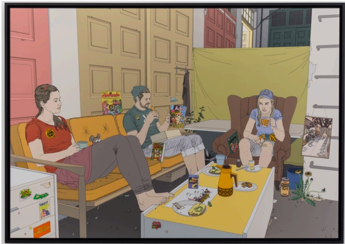
PUBLICERAD 04 MARS 2016 AV MAGNUS BONS