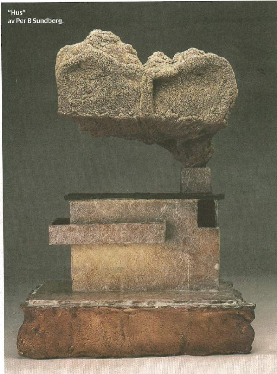
"Hus" av Per B Sundberg.