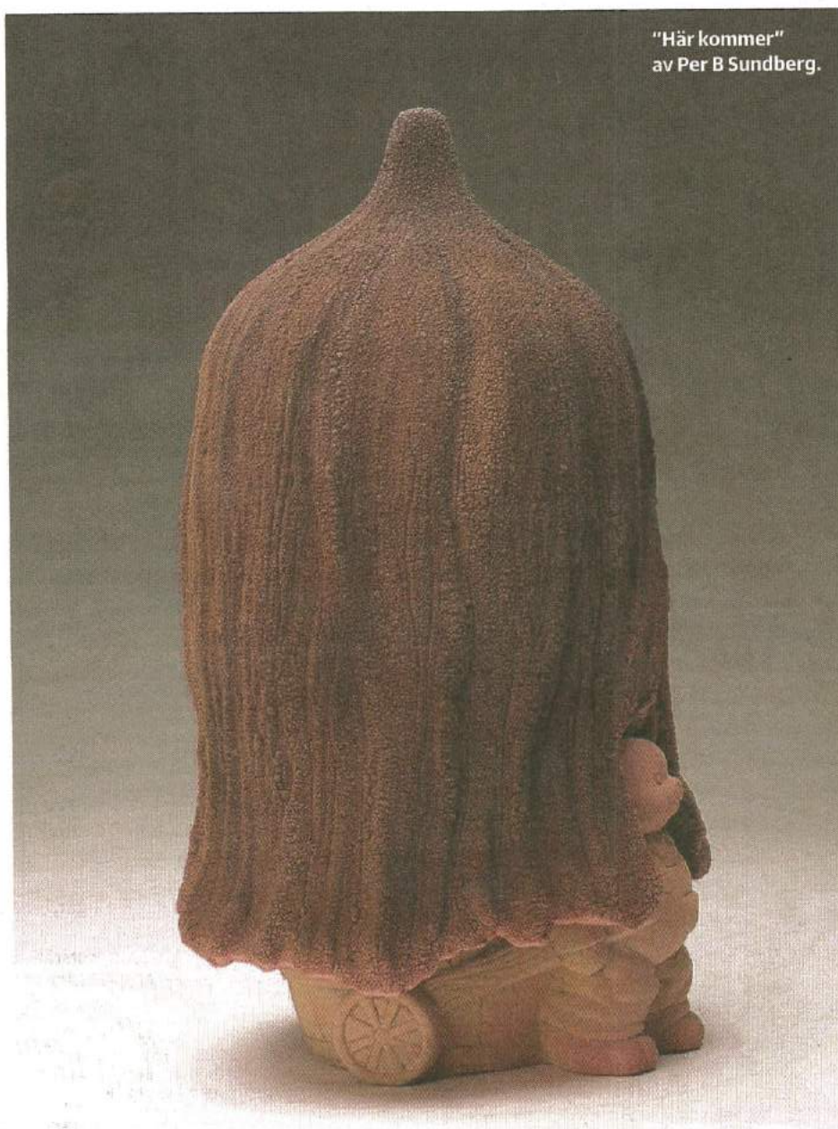
"Här kommer" av Per B Sundberg.

Säsongsöppning. DN Kultur tipsar om höjdpunkter på Stockholms gallerier