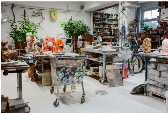
KREATIVT KAOS. Konstnärens ateljé är en blandning av ordning och oreda. Som liten ville konstnären driva en skrothandel ihop med sin far. Konstnären har också hjälpt kollegor i Gustavsbergs gamla porslinsfabrik att bränna Lisa Larson-figurer.

»Det var roligt, det var en bra tid att komma hemifrån på. Lärarna var säkert kristna men det var inget de försökte prångla på oss.«