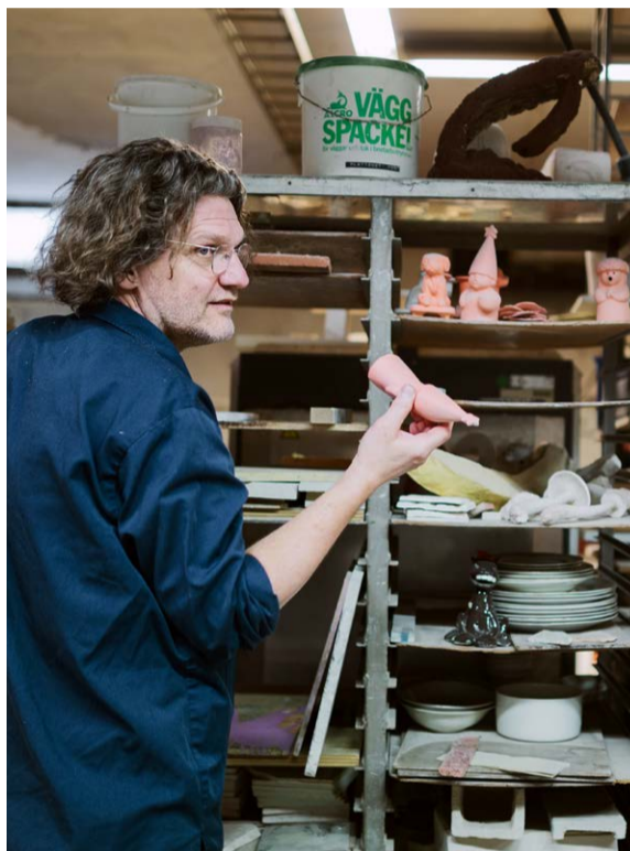
NATURLIGT. Konstnären har blivit intresserad av ämnen från jordskorpan. Hans stenskapelser i lera är avgjutningar av riktiga stenar. Men denna gång blir det färre dödsallar när han ställer ut på galleri Andréhn-Schiptjenko.