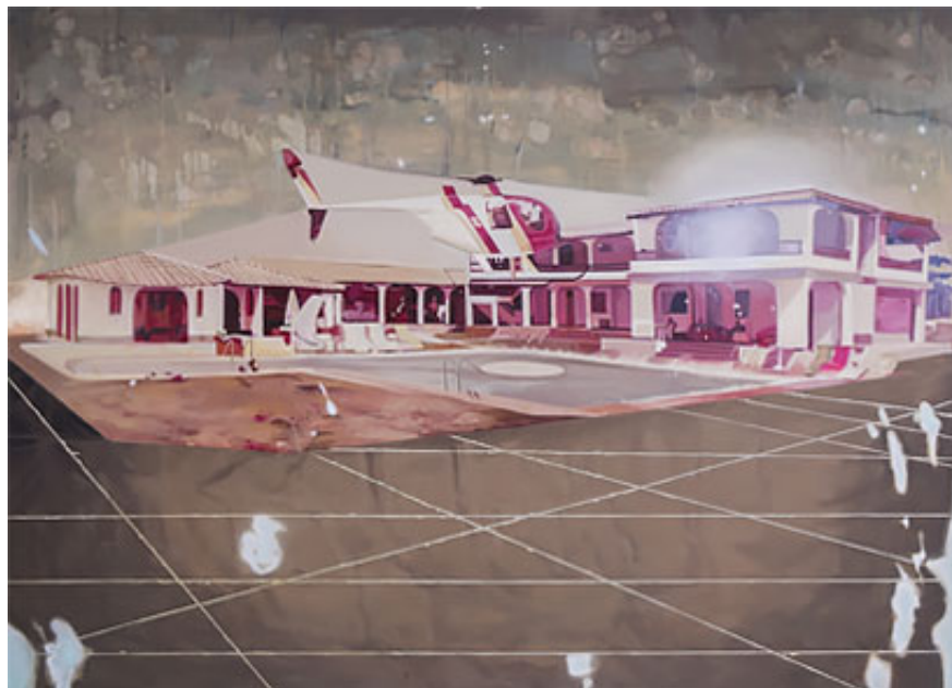
"Falcon 1", 2016, olja på duk, 147,3x205,5 cm © Kristina Jansson