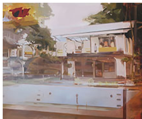
"Falcon 2", 2016, olja på duk, 152x184 cm © Kristina Jansson

Andréhn-Schiptjenko, Stockholm | Omkonsts startside