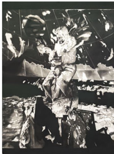
"Receiver", 2016, kol och tusch på papper, 120x91,5 cm © Kristina Jansson

Dagspolitiska referenser , kulturhistoriska sidospår och gäckande återvändsgränder, det är vad Kristina Janssons närmast njutningsfullt bjuder besökaren. Spåren går att följa lika enkelt som Ariadnes tråd, men denna gång inte ur utan in i labyrintens irrgångar. I hennes andra utställning på Andréhn-Schiptjenko finns kopplingar både till latinamerikansk maffia och till amerikansk penningfixering, bland mycket annat.