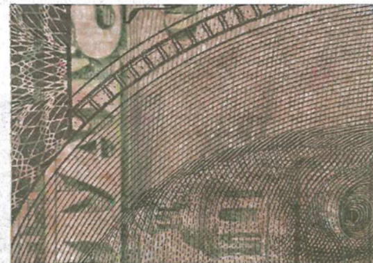
"Million dollar painting", 2016. FOTO: ANDRÉHN-SCHIPTJENKO