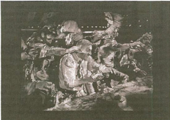
"Pitcher", kol på papper, 2016.