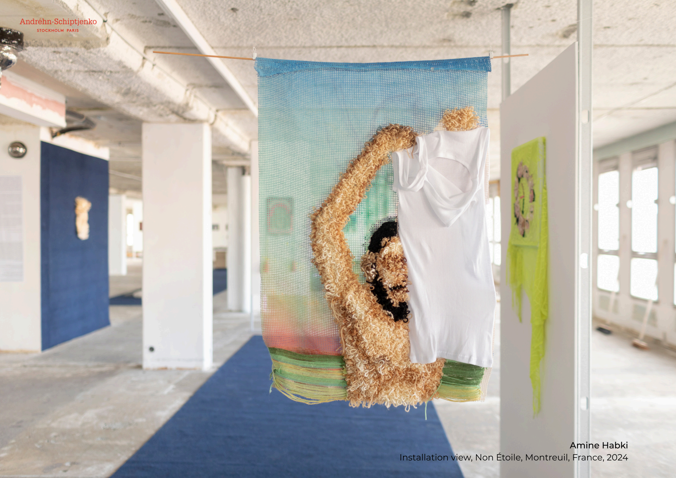
Amine Habki Installation view, Non Étoile, Montreuil, France, 2024