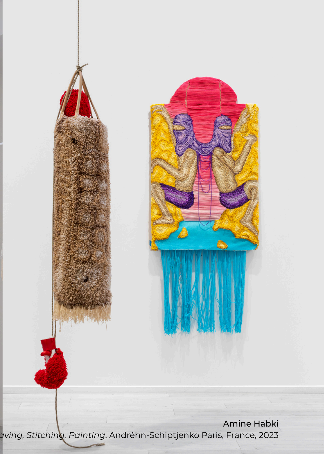
Amine Habki Installation view, Weaving, Stitching, Painting , Andréhn-Schiptjenko Paris, France, 2023