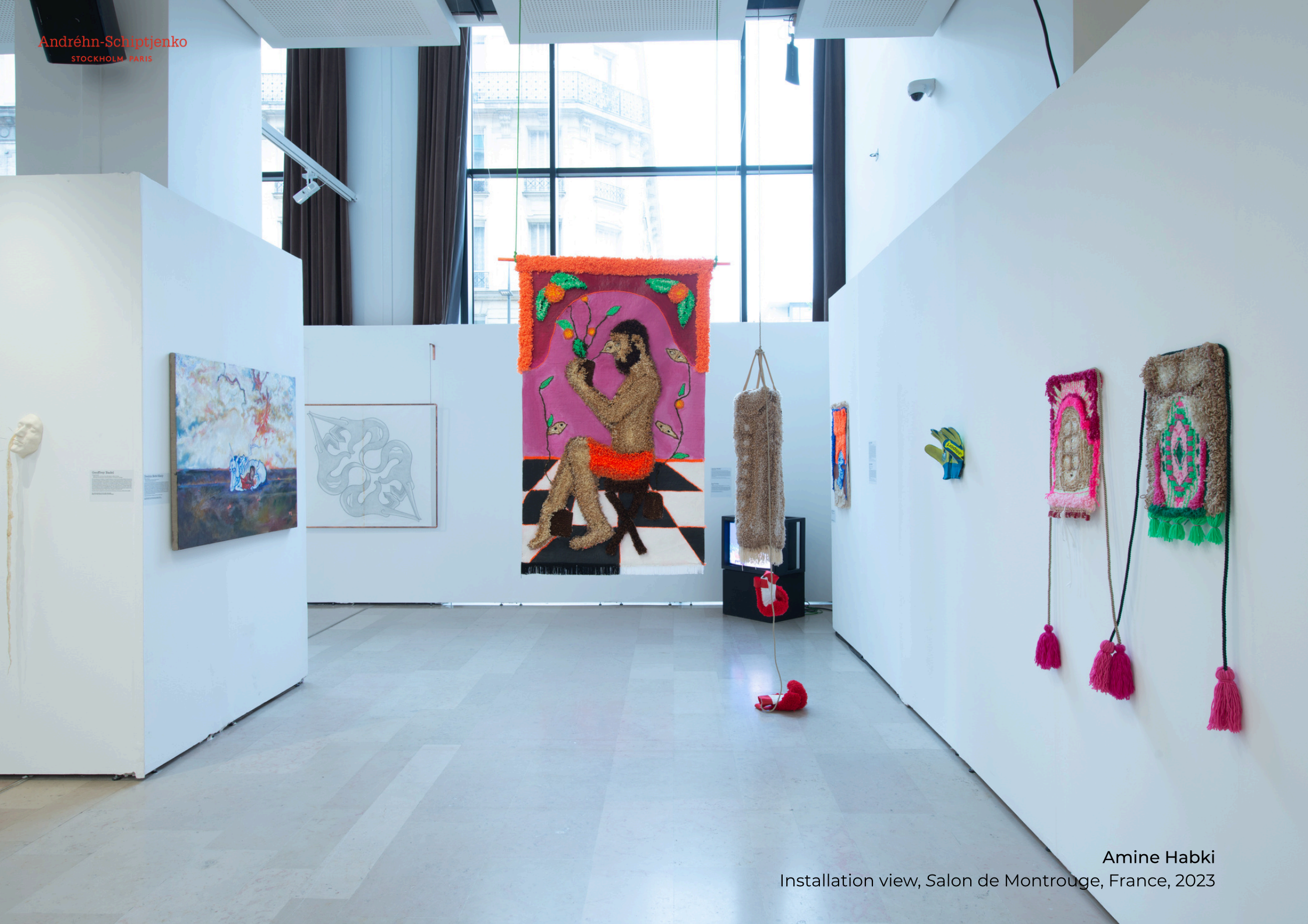
Amine Habki Installation view, Salon de Montrouge, France, 2023