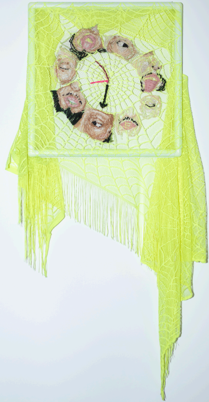
Amine Habki Installation view, Non Étoile, Montreuil, France, 2024