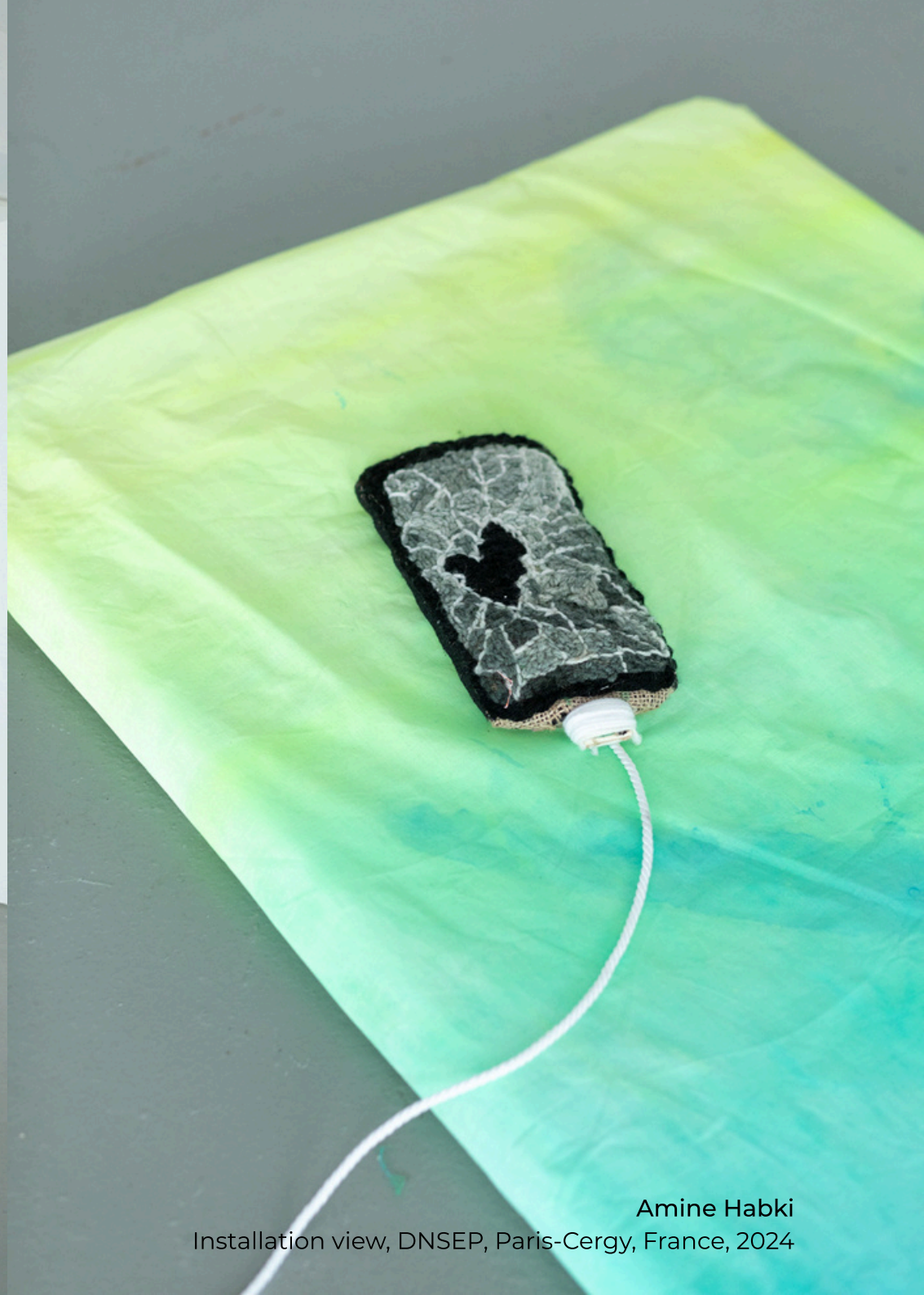
Amine Habki Installation view, DNSEP, Paris-Cergy, France, 2024