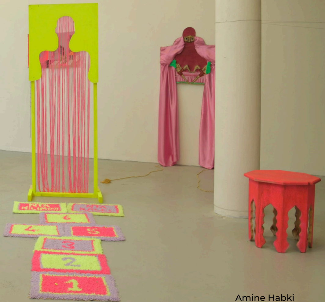
Amine Habki Installation view, DNSEP, ENSAPC, Cergy, France, 2022