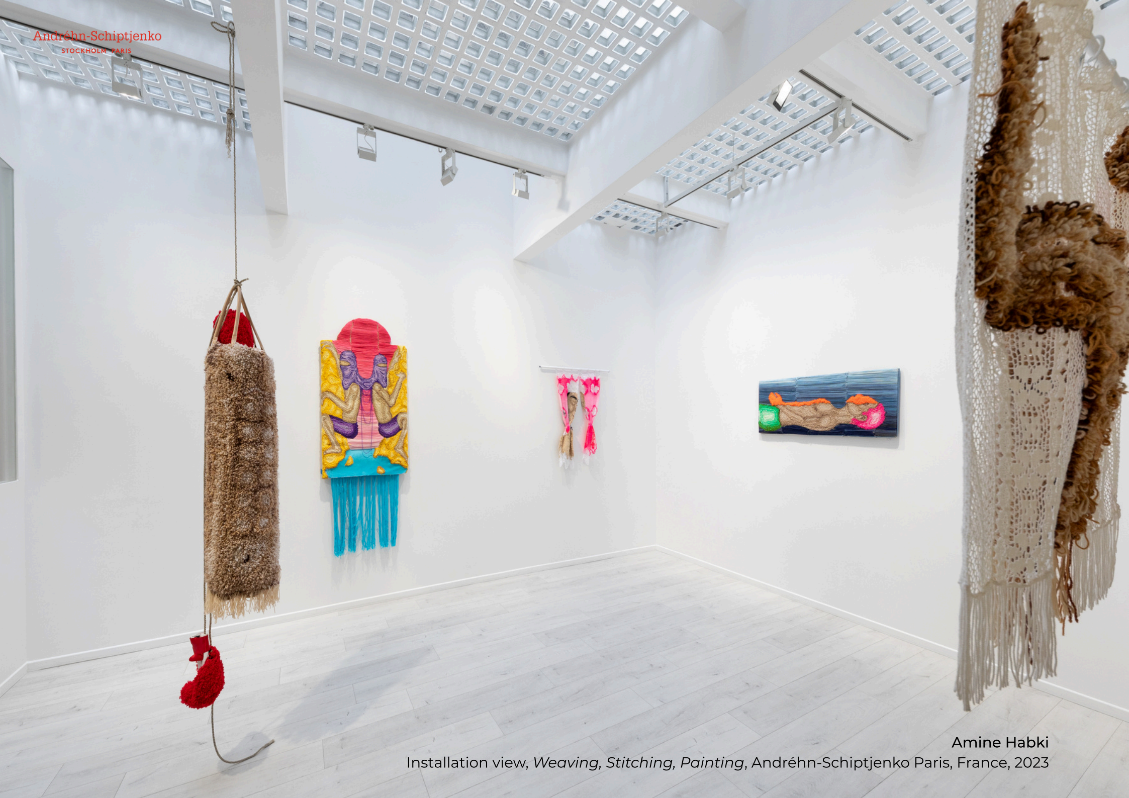
Amine Habki Installation view, Weaving, Stitching, Painting , Andréhn-Schiptjenko Paris, France, 2023